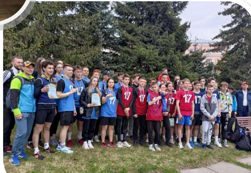
Легкоатлетическая эстафета на приз газеты «Заря Урала»