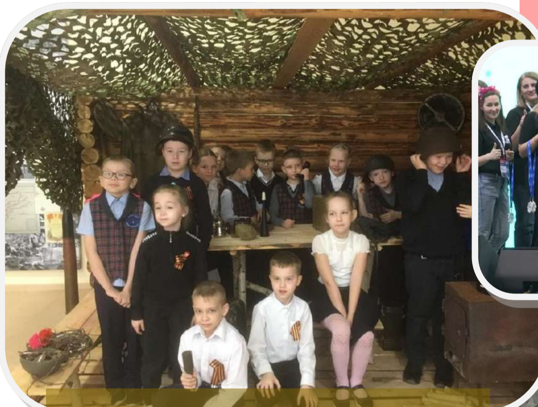
Музейные уроки для первоклассников, посвященные Дню Победы!