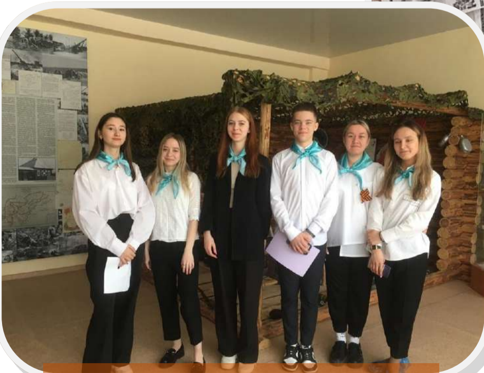
Диктант Победы 2023