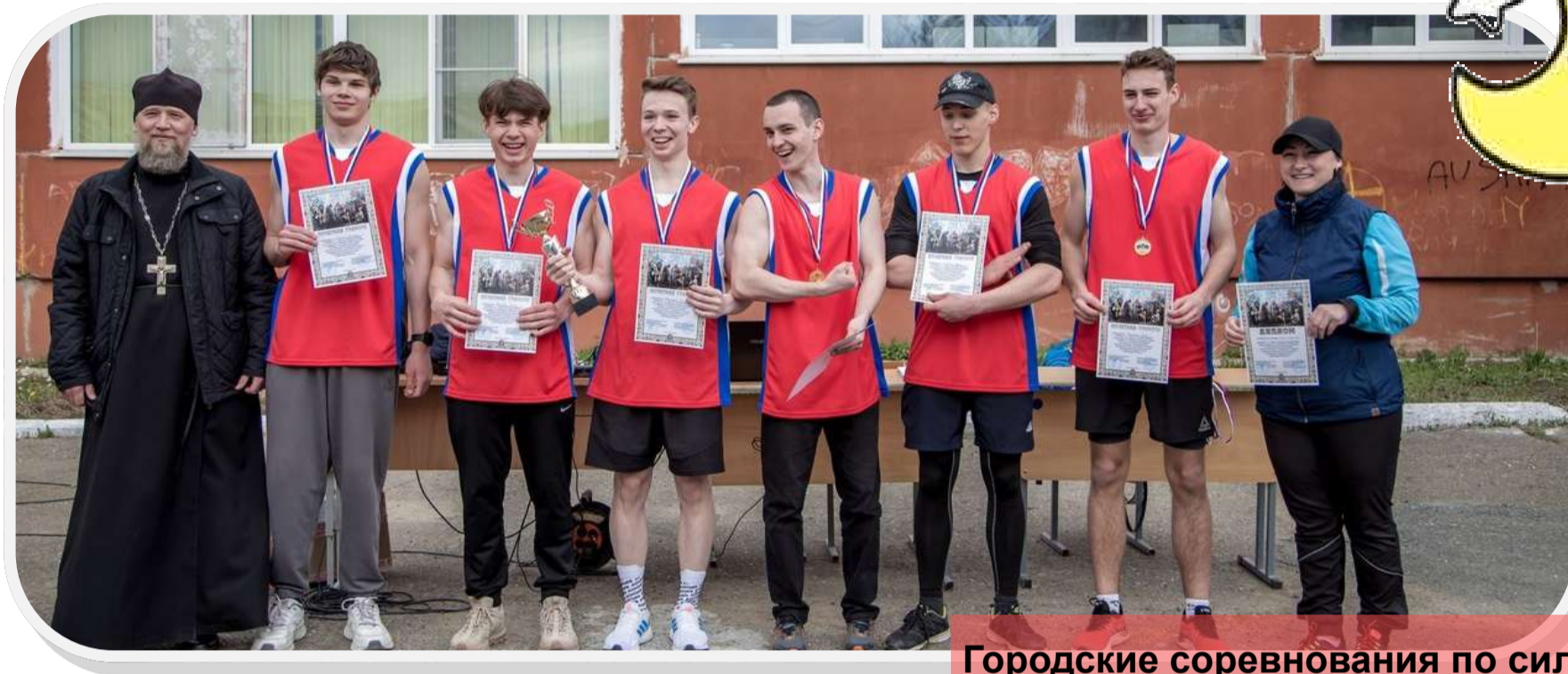
Городские соревнования по силовому многоборью «Русский силомер»