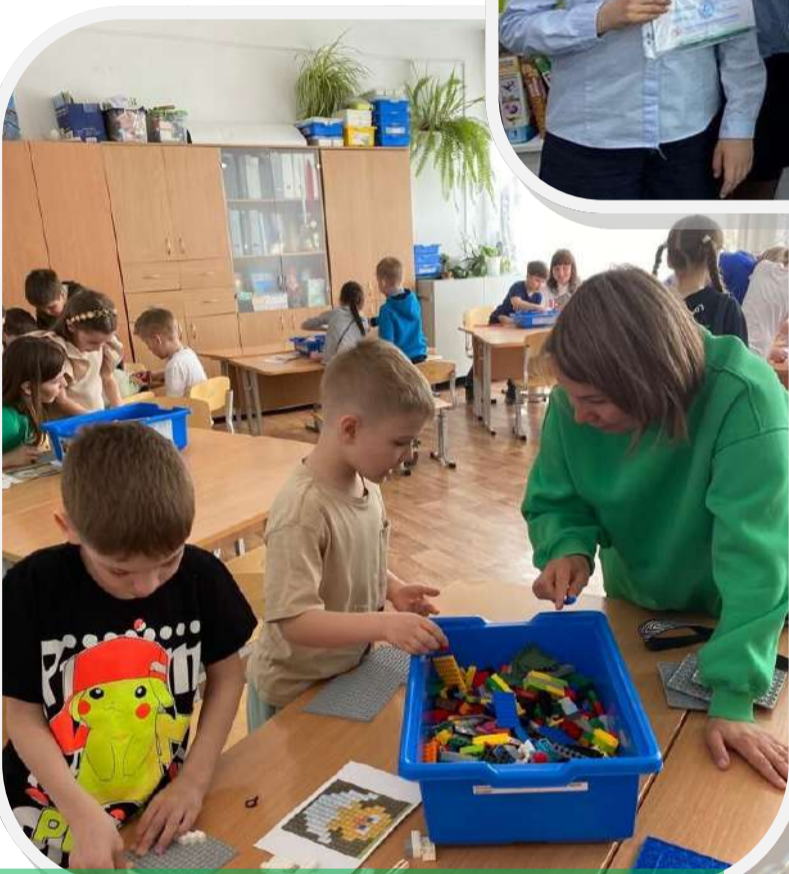
День открытых дверей для родителей и будущих первоклассников