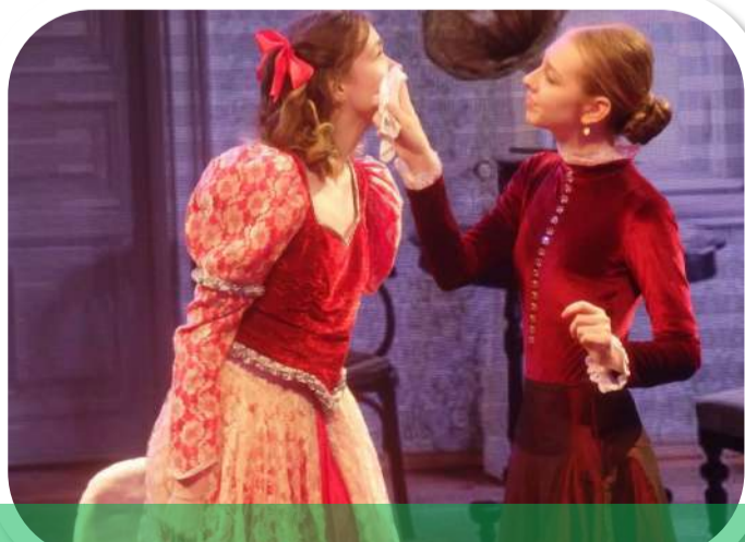
Городской фестиваль театрального искусства «Солнечный зайчик-7»