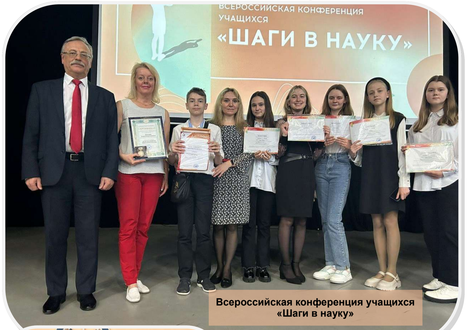
Всероссийская конференция учащихся «Шаги в науку»