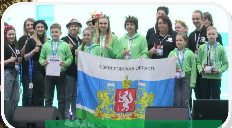
Национальный Чемпионат по робототехнике