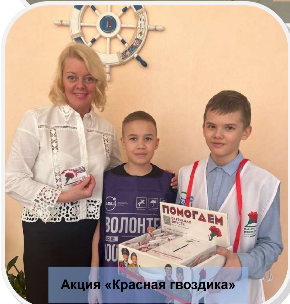
Акция «Красная гвоздика»