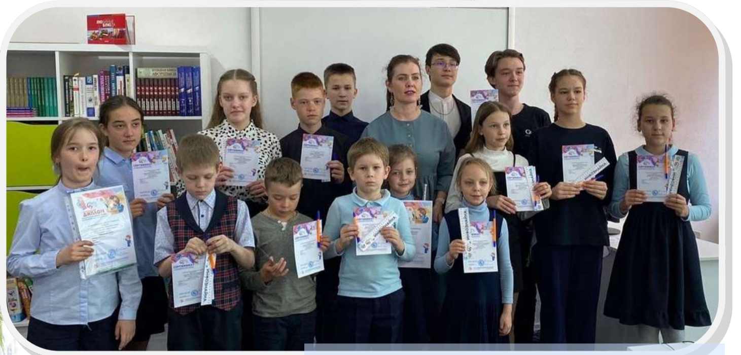
Конкурс «Инфознайка 2023»